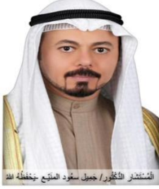
المستشار الدكتور / جميل سعود المنيع يحفظه الله