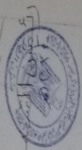
شهادة سحب الأوراق في الفرقة الثالثة من كلية التجارة-جامعة قناة السويس، للعام الجامعي: (٢٠٠٩/٢٠١٠م).