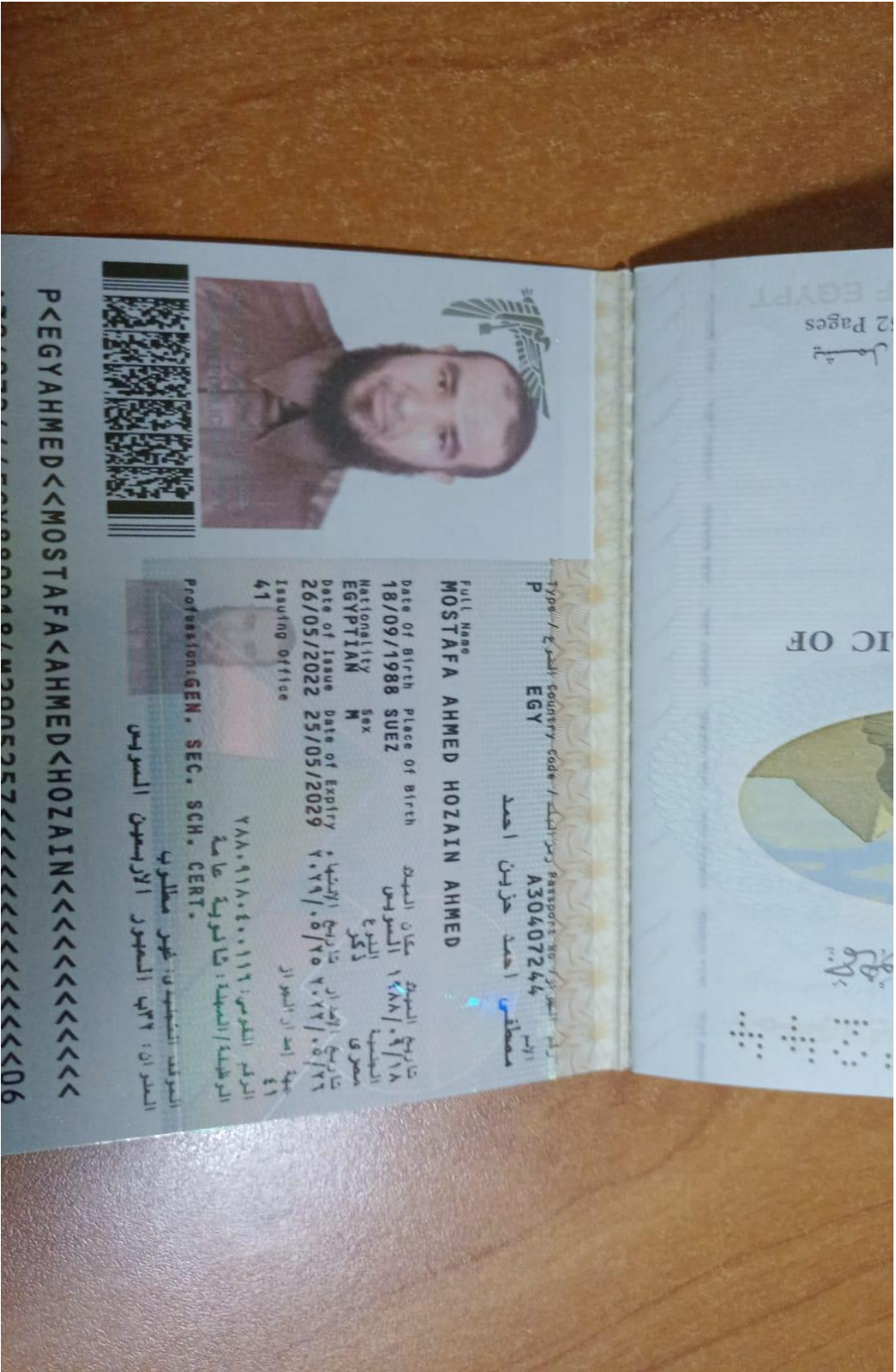
جواز السفر، ورقمه: (A30407244)