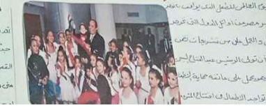
اهتمام برئيس بأبناء بستراد