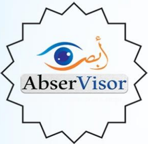
أبصر فايزر للمخيمات الافتراضية www.abservisor.com