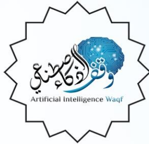
وقف الذكاء الاصطناعي www.waqf.ai