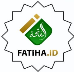
منصقة الفاتحة www.fatiha.id