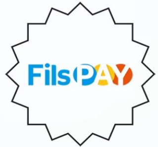
بوابت فليسي للدفع الإلكتروني www.filspay.com