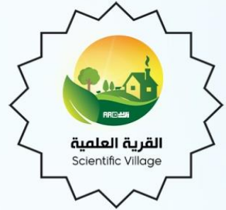
القرية العلمية sci-village.com