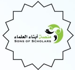
منصقة أبناء العلماء sos.arid.my