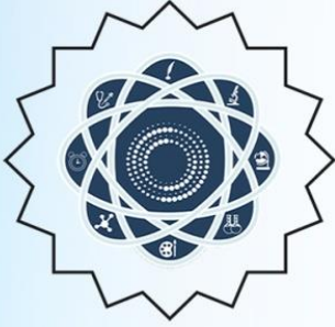
المدهفل العلمي الدولي www.almahfal.org