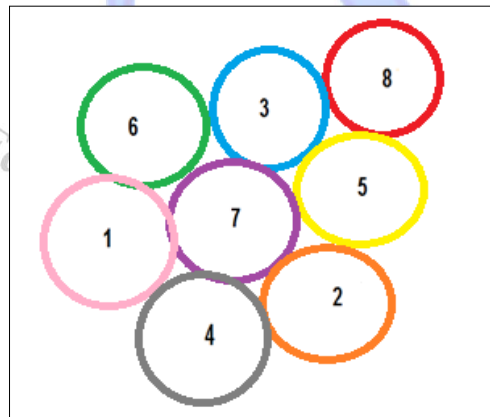
الشكل (2) يوضح اختبار التوافق للرجلين

التسجيل: يسجل للمختبره الزمن الذي تستغرقه في الانتقال عبر الثماني دوائر.