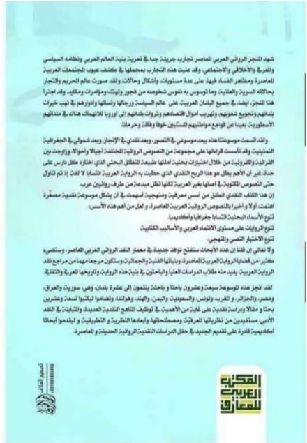
صورة لغلاف الجزء الثاني