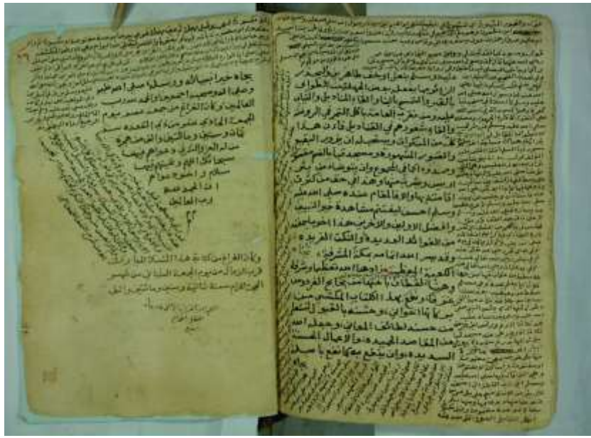
صورة الورقة الأخيرة من المخطوط