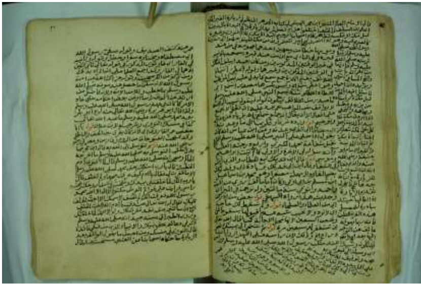
صورة ورقة من وسط المخطوط