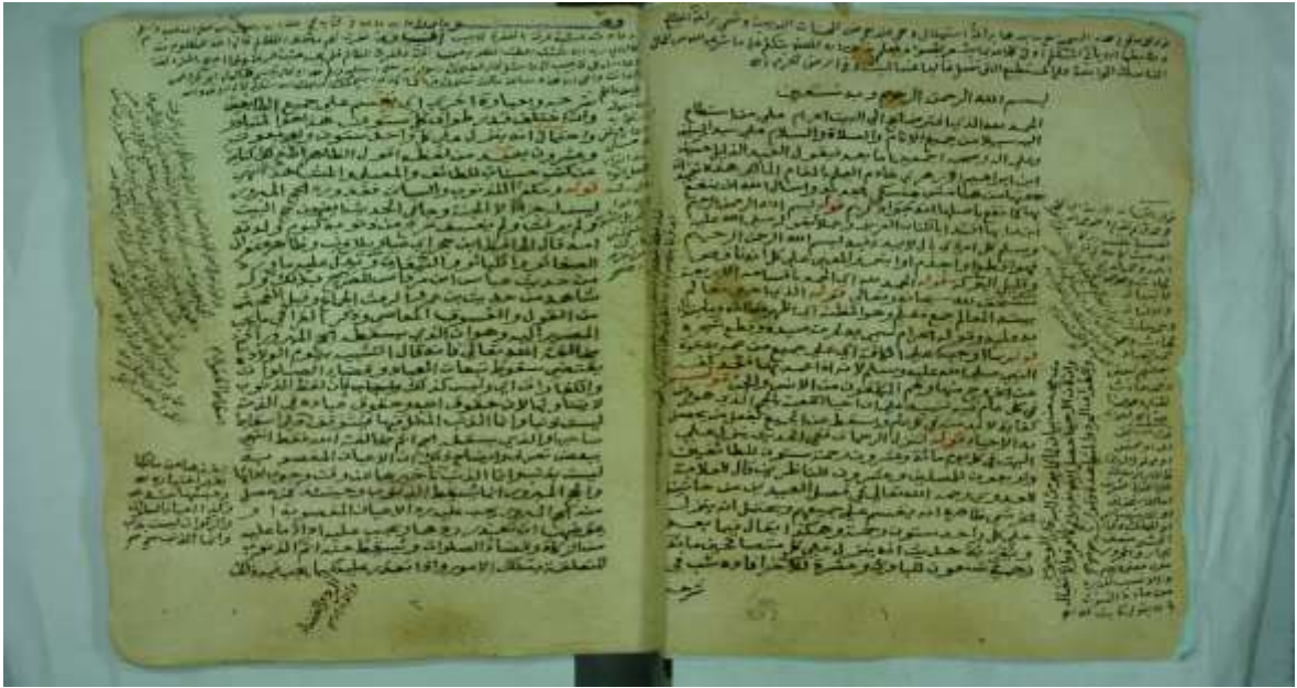
صورة الورقة الأولى