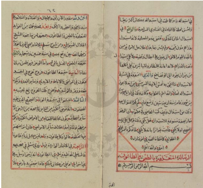
صورة الورقة الأولى من نسخة المكتبة الأزهرية