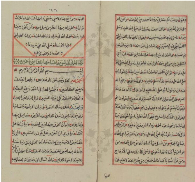
صورة الورقة الأخيرة من نسخة المكتبة الأزهرية