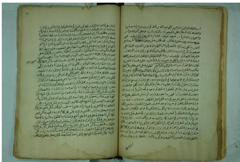
صورة الورقة الأولى من المخطوط