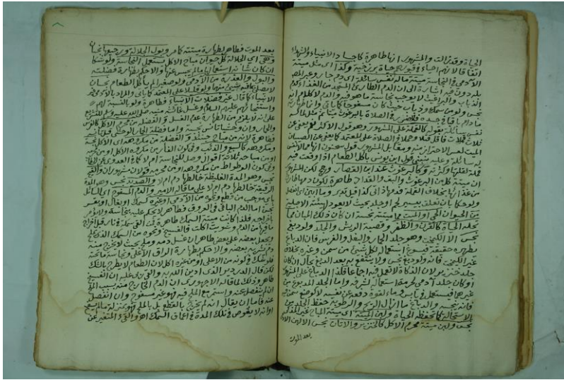
صورة ورقة من وسط المخطوط