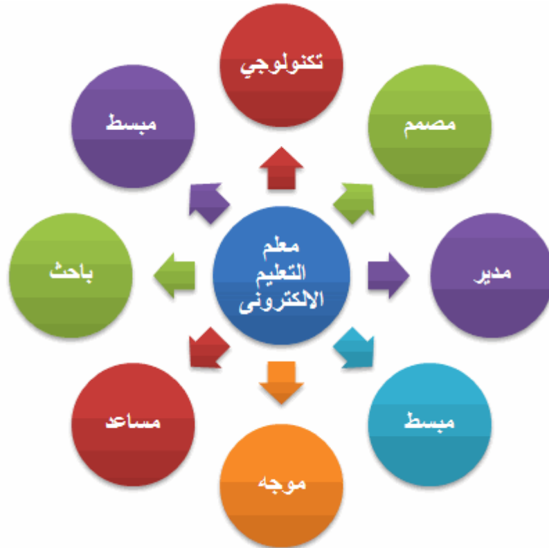
الأدوار الرئيسية لمعلم التعليم الالكتروني