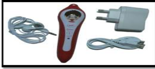
الشكل رقم (06) يوضح شكل القلم الالكتروني الناطق