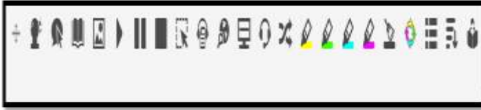
الشكل رقم (04): يوضح واجهة برنامج ريد ورايت (Read & Write)

أنحاء العالم، وهو عبارة عن شريط الأدوات سهل الاستخدام، يتيح لمستخدمه العديد من الخيارات أهمها قراءة كل ما هو في الشاشة، يستخدمه ذوي صعوبات التعلم والأفراد المعسرين قرائيا.