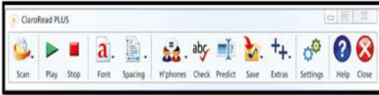
الشكل رقم (05) يوضح واجهة برنامج كلارويد (ClaroRead)

وهو برنامج حاسوبي سهل الاستخدام وبسيط للغاية، يساعد التلاميذ على القراءة وكذا الكتابة، حيث يستطيع هذا البرنامج قراءة أي نص موجود على الشاشة، بصوت واضح ومفهوم، إضافة إلى انه بإمكانه قراءة المستندات والكتب الالكترونية، أو الوثائق المعالجة بواسطة الماسح الضوئي، ويعبر عن هذا البرنامج أحد المختصين كآلاتي: إن التلاميذ يحبون برنامج كلارويد ، حيث أصبح التلاميذ الذين يعانون من عسر القراءة يعتمدون عليه في نشاطاتهم المدرسية، إن هذا البرنامج يحدث فارقا رائعا لتلامذتنا الذين هم يكافحون.