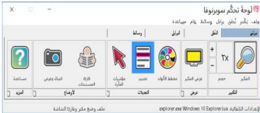
الشكل رقم (07) يوضح شكل برنامج سوبرنوبا (Supernova)

ويعتبر هذا البرنامج من بين البرامج القارئة للشاشة، وقد صمم هذا البرنامج في الأصل للمكفوفين وضعاف البصر، كما تستخدمه المؤسسات والمراكز التي تهتم بالتحديات البصرية، ومن هذا المنطلق يمكن أن نستعين بهذا البرنامج بالاعتماد على خاصية النطق فيه مع حالات اضطراب النظر (ليس اضطراب البصر) عند ذوي عسر القراءة هذه الفئة التي تجد صعوبة في التقاط المعلومة بصريا، نتيجة الحركة المستمرة لبؤبؤ العين. البرنامج يتكون من برنامجين فرعيين يتمثلان في برنامج هال قارئ الشاشة، وبرنامج مكبر الشاشة.