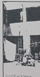
مدرسة علي بن ابي طالب في الموصل