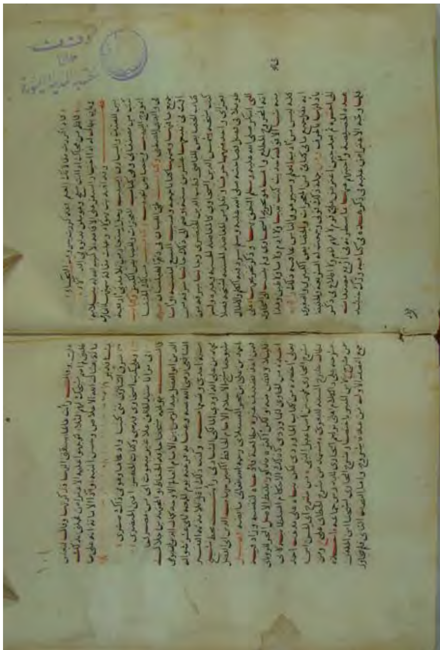
الورقة الأخيرة من الأصل