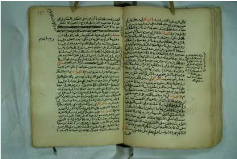
صورة ورقة من وسط المخطوط