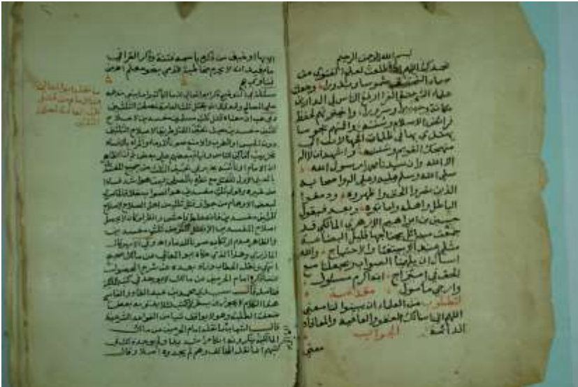
صورة الورقة الأولى