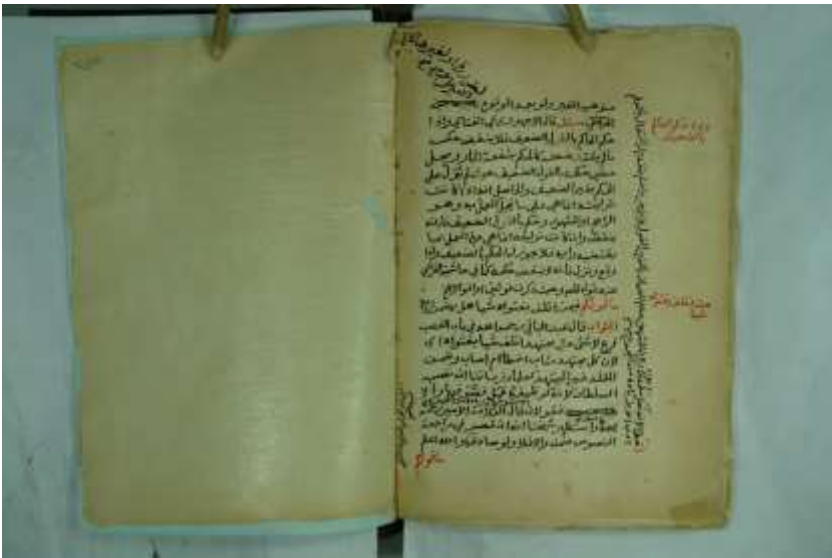
صورة الورقة الأخيرة من المخطوط