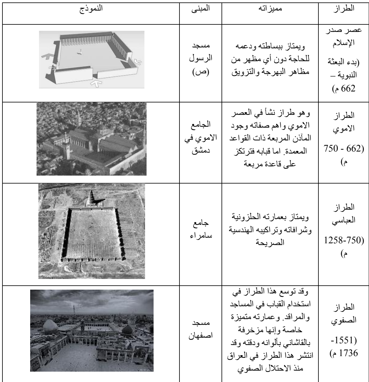
جدول (1) يوضح التباين في طرز عمارة المساجد عبر العصور (الباحثون عن، طاهر 2013)

الطرز: جمع طراز. ويراد بها الهيئة التكوينية العامة والصور المبتكرة للشكل المعماري بما في ذلك العناصر الأساسية والعناصر الثانوية. وليس هناك طراز ثابت او مقسم يمكن الاعتماد على عناصره الأساسية على فرض انها لا تتغير تغيرا كبيرا من مكان لآخر او من وقت لغيره. ولهذا جاءت الطرز المتشابهة اسلوبا، مختلفة اختلافا جوهريا في الكثير من اقسامها ( يهنسي، 1979، ص 111). ولسنا هنا بصدد استعراض الطرز المختلفة للعمارة التي انتجها المسلمون، بقدر ما نحاول ان نورد هذا الموضوع كونه دليلا على اختلاف النتاجات المعمارية التي انتجها المسلمون عبر العصور كما اننا سوف نقتصره على المساجد كون هذا النمط البنائي من أوائل ما انتجه المسلمون من عمران. (جدول 1)