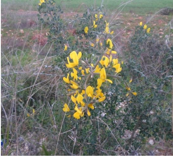
صورة (6) Pistacia lentiscus (Anacardiaceae)