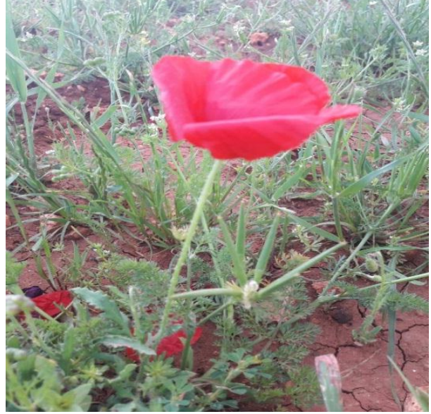
صورة (1) Bellis sylvestris Beg. (Asteraceae)