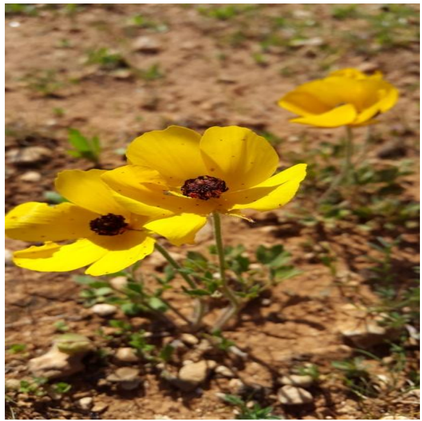
صورة (7) Lolium roseum L (Alliaceae)