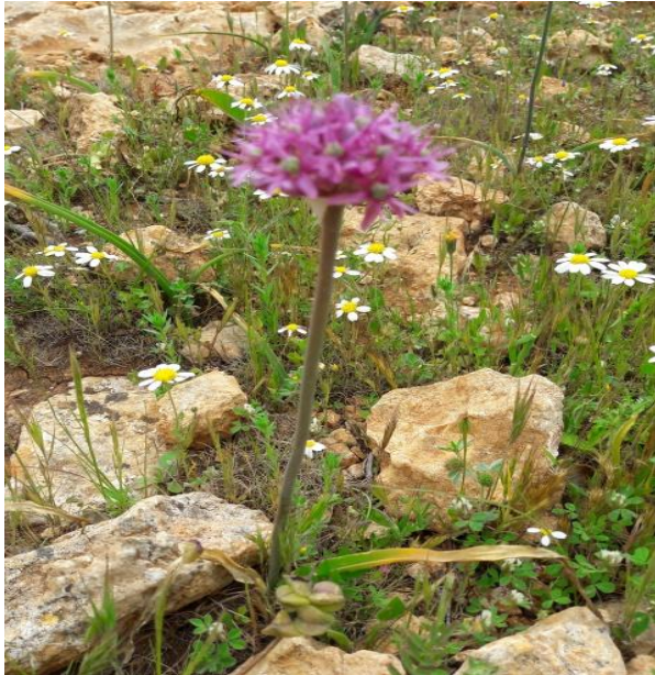
صورة (8) Ranunculus asiaticus L (Ranunculaceae)