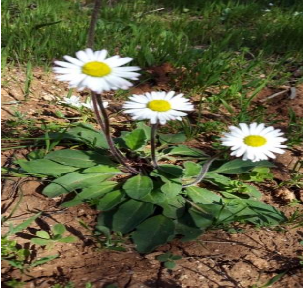
صورة (2) Papaver hybridum L. (Papaveraceae)