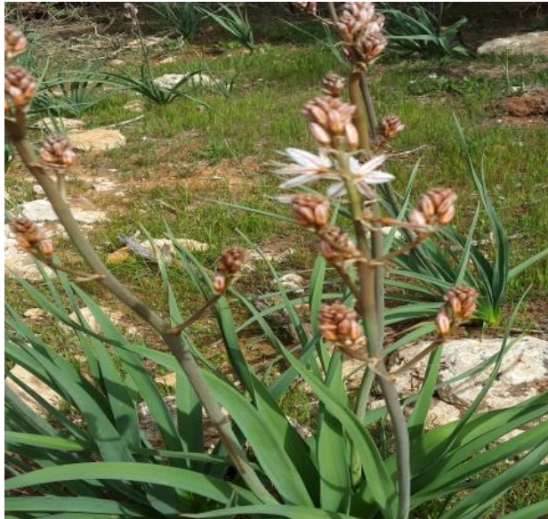
صورة (4) Urginea maritime (L.) Baker (Liliaceae)