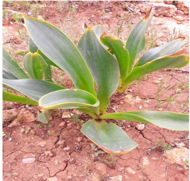
صورة (3) Asphodelus microcarpus Salzm (Liliaceae)