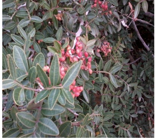
صورة (5) Calicotome villosa (Poir) Link (Fabaceae)