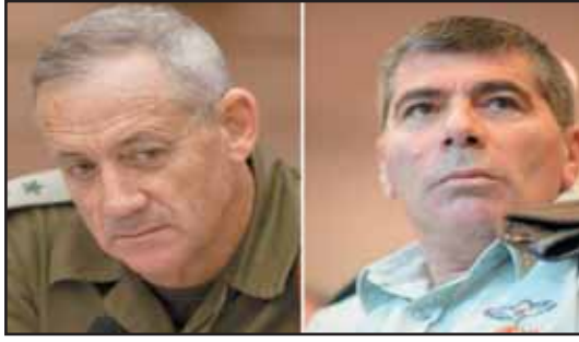
قائد الجيش الاسرائيلي السابق بيني غانتس وجابي اشكنازي.