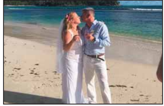
عضو الكنيست سيفتولوا مع زوجها الجديد

ويجد مواطنو الاتحاد السوفياتي سابقاً عراقيل وشروط صعبة عندما يسجلون زواجهم رسمياً!