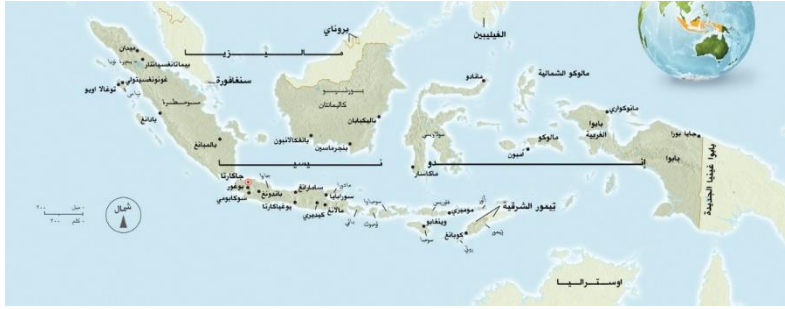
الخريطة عن بلاد الإندونيسي

هو: " Bhinneka Tunggal Ika " (الذي يعني "الوحدة في التنوع").