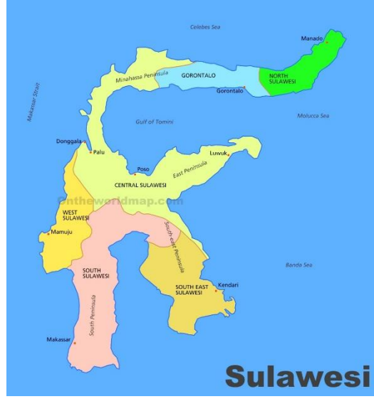
الخريطة جزيرة سيليبس (سولاويسي)

وجزر المالوكو، وهي مجموعة جزر كانت تُعرف باسم جزر التوابل وأهمها جزيرة