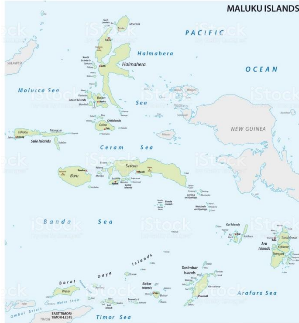
الخريطة الجزر مالوكو