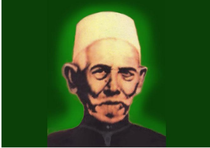
العلامة الشيخ محمد بن عمر النووى الجاوي البنتني