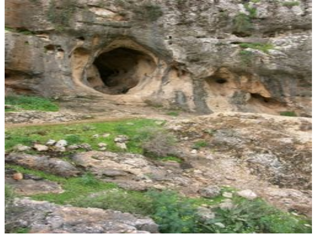
صورة رقم (٣)

رسم تخيلي للإنسان الأول ومحاولته إشعال النار