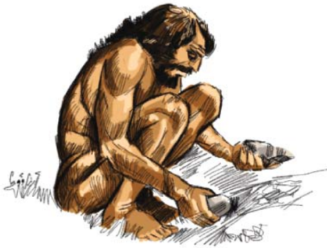
شكل رقم (١)

إعادة تركيب لتخيل شكل إنسان شانيدار بناء على تركيب مجتمه