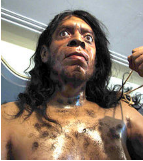
صورة رقم (٥)

إعادة تركيب لتخيل شكل إنسان شانيدار بناء على تركيب مجتمه