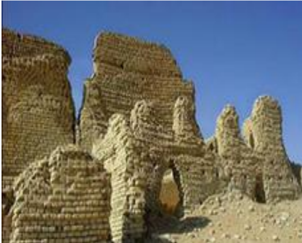
صورة رقم (١)

جزيرة القرن الذهبي شمال بحيرة قارون في الفيوم