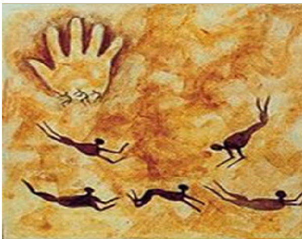
صورة رقم (٢)

جزيرة القرن الذهبي شمال بحيرة قارون في الفيوم