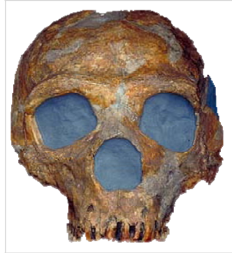
صورة رقم (٤)