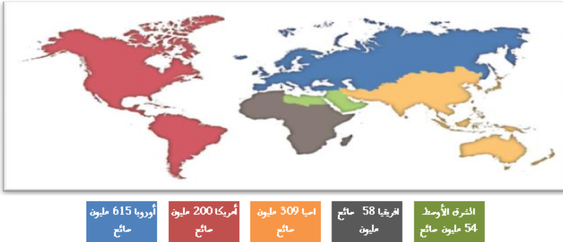
الشكل رقم 01: حركة السياح الوافدين دوليا لسنة 2016