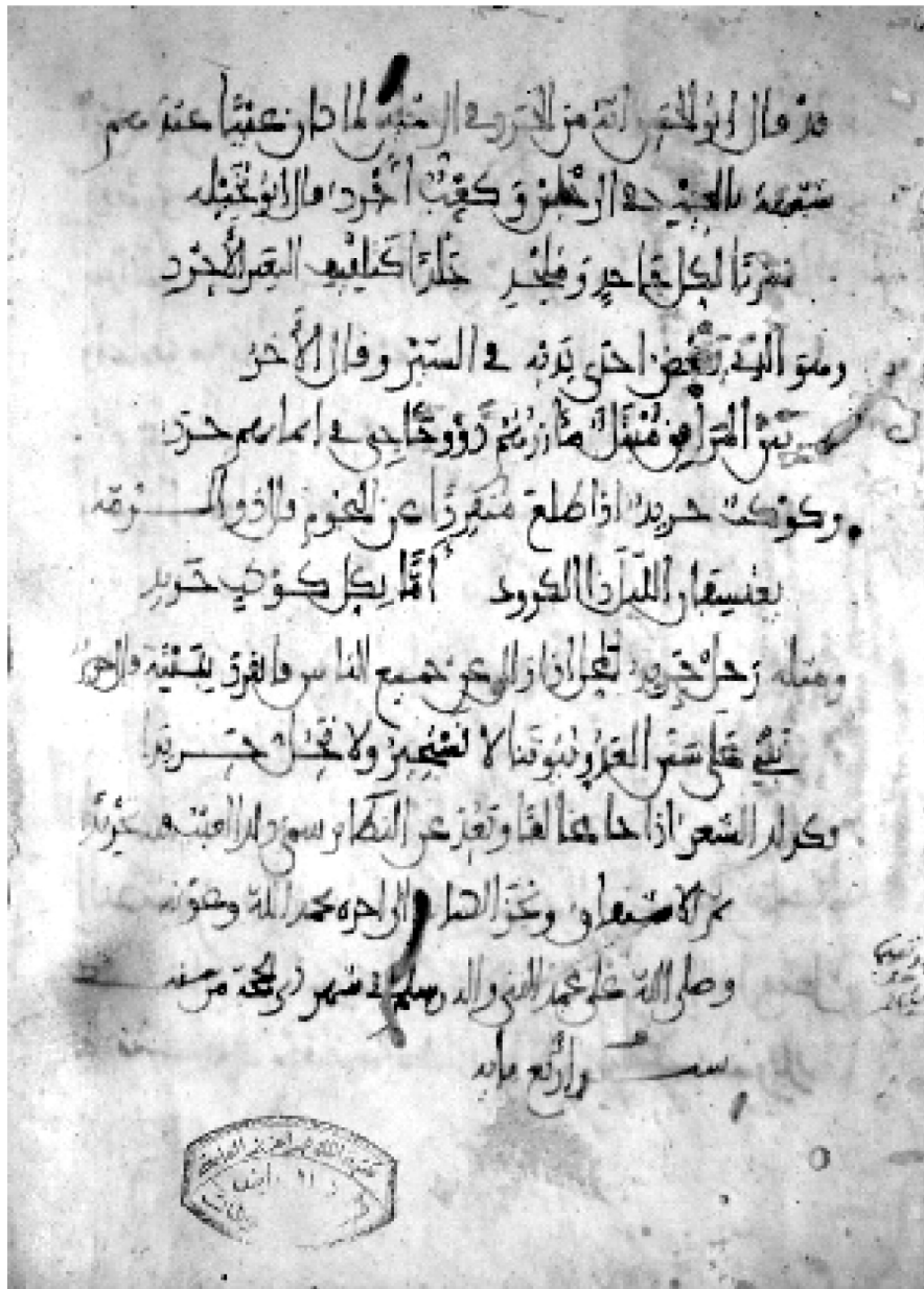
صورة الورقة الأخيرة من مخطوط (المعرب)