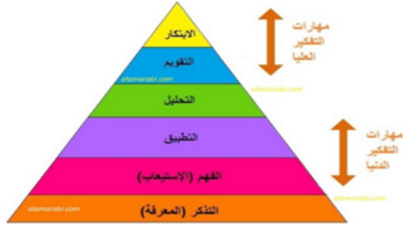
الشكل (2) يوضح الأقسام الرئيسية لبعده العملية المعرفية لتصنيف بلوم المعدل

اجلها. وفي ضوء آراء الخبراء والمناقشات التي اجراها الباحث معهم. لم يتم حذف أو تبديل في أي من الأهداف المعرفية. وعدت القائمة صالحة لتحليل خطوات التحليل: